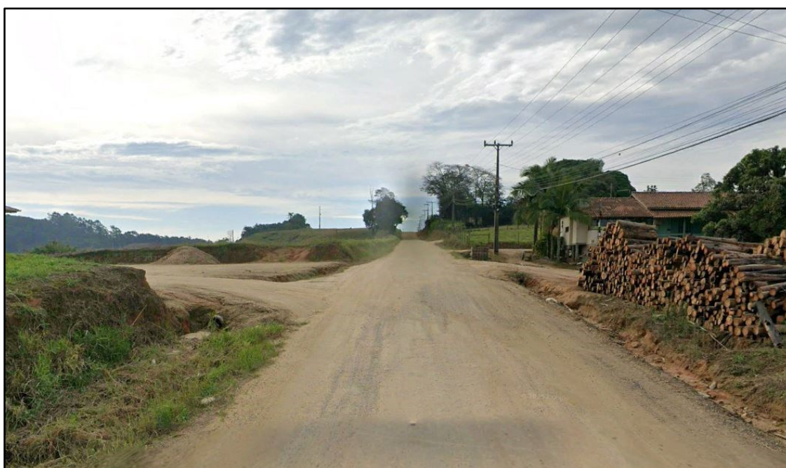
Figura 3: Rod. Mansueto Maccari – situação atual

Diante do exposto, tem-se a necessidade de obras de terraplanagem, drenagem pluvial, pavimentação asfáltica e sinalização viária. Tal infraestrutura promoverá melhoria da mobilidade e integração viária, redução de custos aos motoristas e ao município, aumento da segurança viária e desenvolvimento econômico regional.