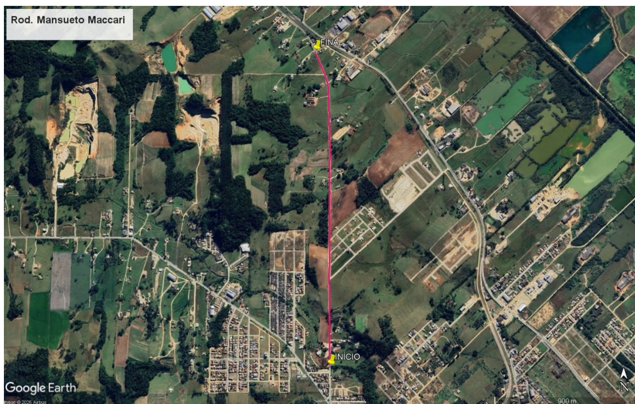
Figura 1: Localização

A presente contratação observará os preceitos da Constituição da República Federativa do Brasil de 1988 e se regerá pelos preceitos da Lei 14.133/2021, bem como demais requisitos legais e normativos que regem a matéria. E, para que a execução dos serviços ocorra de forma otimizada e atenda aos interesses do município, faz-se necessária a contratação de empresa especializada apta a atingir os objetivos almejados com confiabilidade, segurança e qualidade nos serviços prestados.