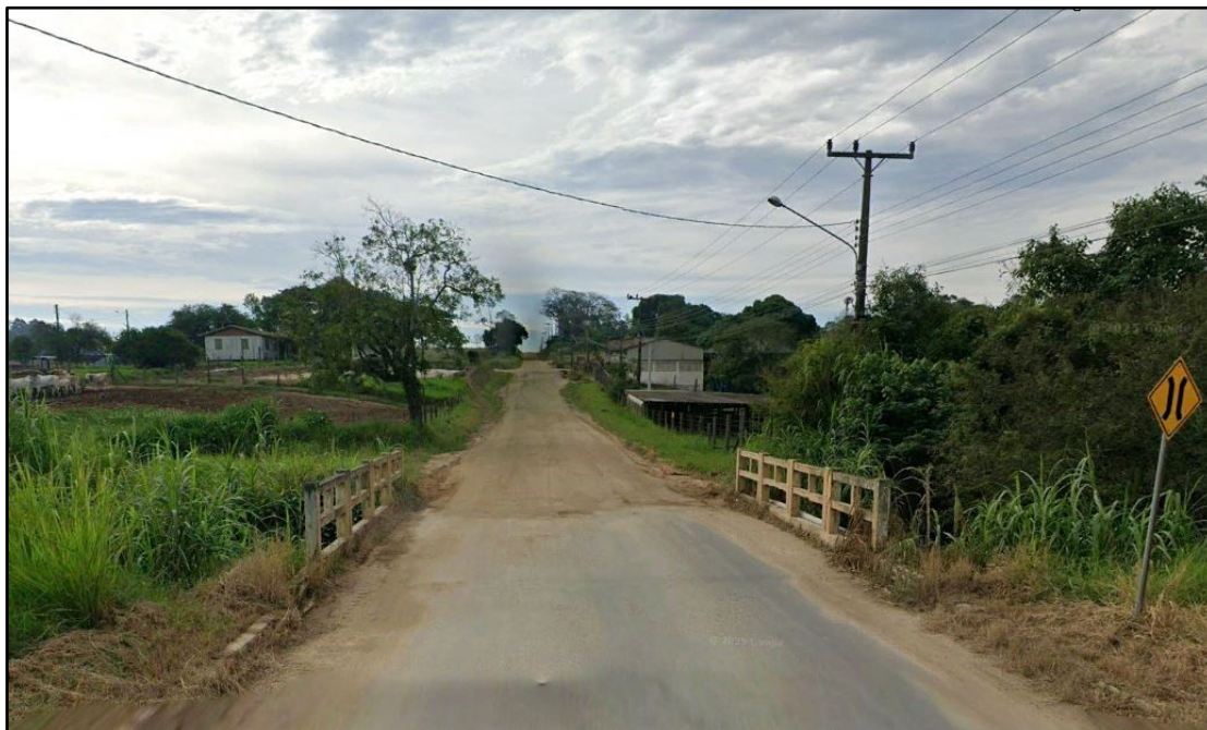
Figura 2: Rod. Mansueto Maccari – situação atual